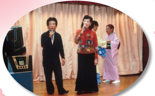
自慢ののどで聴かせます