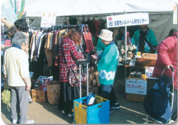
オリジナル商品も好評でした