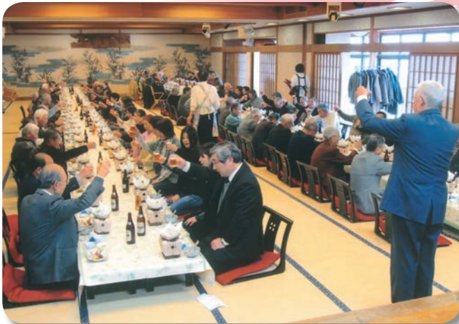
今年こそ良い年に 乾杯！