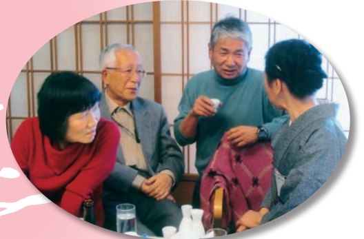
ほほおー、なるほど